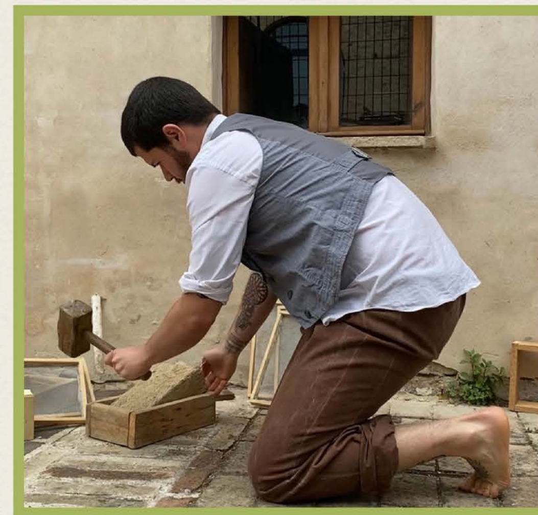
Il Maestro d'Atterrati