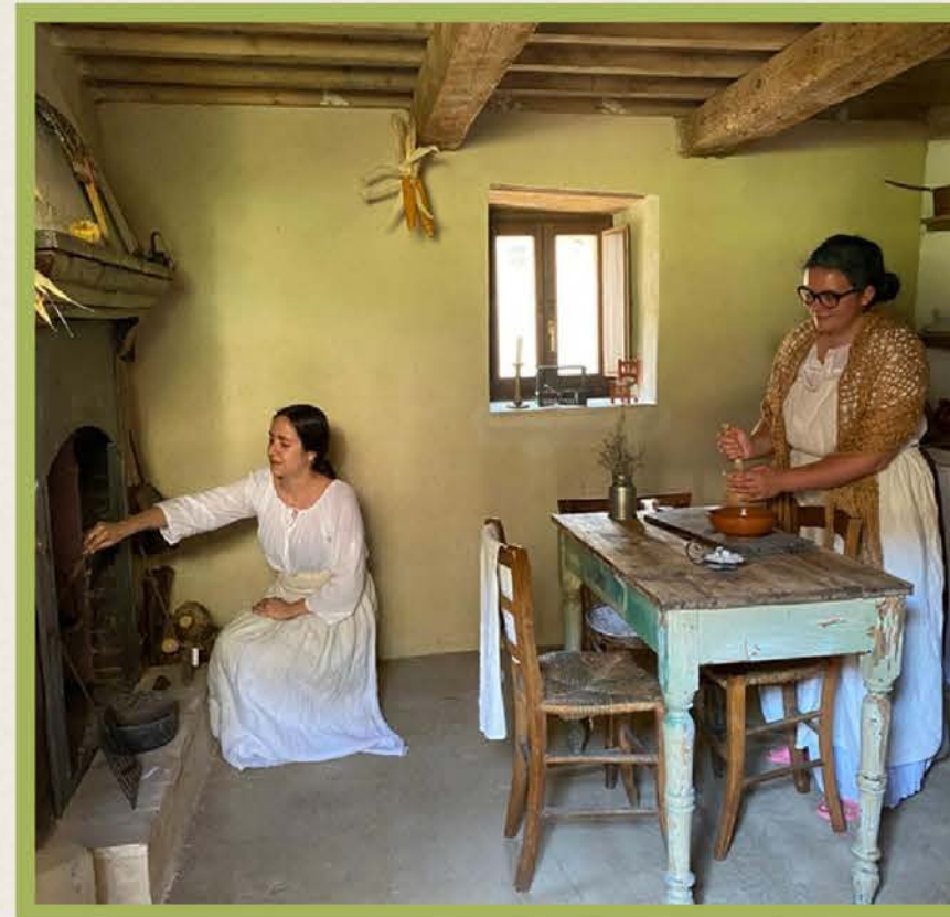
La Casa Museo

Tutelato dalla Soprintendenza ai Beni Culturali delle Marche dal 2003, il borgo offre al suo interno una Casa Museo , l' Officina dei Mestieri e percorsi didattico culturali realizzati in collaborazione con i volontari del Servizio Civile Universale e del Corpo Europeo di Solidarietà.