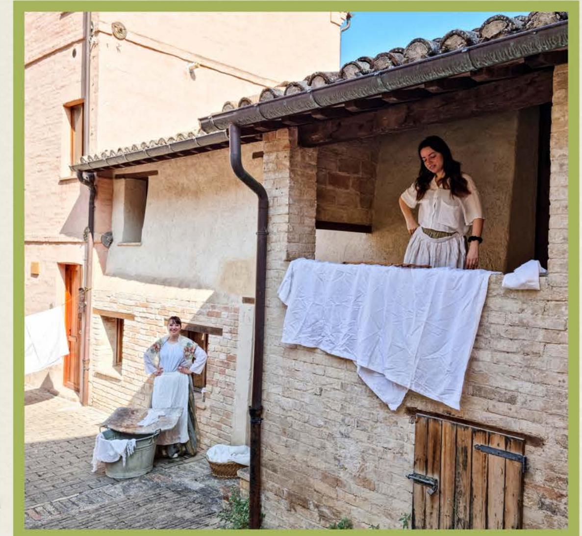
Il bucato delle lavandaie

6 € ad alunno (il contributo comprende tutti i materiali necessari alla realizzazione dell'attività e la visita all'Ecomuseo)